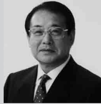
福岡県知事 麻生 渡

最後に、今日まで本行事に積極的に参加頂き、ご支援頂きました会員、賛助会員の皆様に心から謝意を表すると共に、関係各位には今後ともご指導、ご協力を宜しくお願い申し上げます。