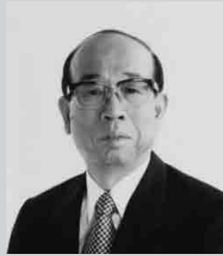
北九州市長 末吉 興一