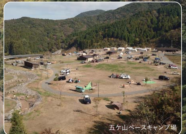
五ヶ山ベースキャンプ場