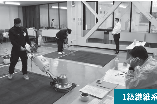
1級繊維系床部分洗浄作業