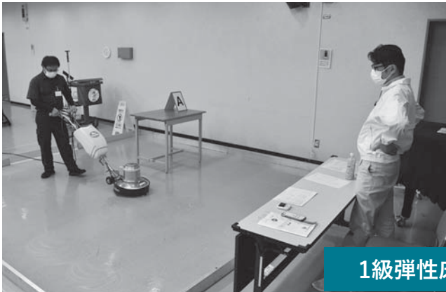
1級弾性床表面洗浄作業

最後になりましたが、実技直前講習会へ講師・指導員を派遣していただきました企業代表者様、誠にありがとうございました。