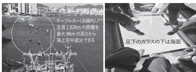
ケーブルカー(点線内)は全長1.62kmの距離を最大86mの高さから海上空中遊泳できる

釜山金海国際空港に到着後、バスでチャガルチ市場に赴き、福岡の魚市場では見ることでできない大量の新鮮なカニなどを見学しながら国際市場へ移動。美味しい昼食をとり、皆さんお待ちかねの自由時間となりました。国際市場の中を探索したり、ブランド物(?)を物色したり、思い思いの時間を堪能されていました。ちなみに私は、探索後少し疲れたので足つぼマッサージを1時間程度受け、心身ともにリフレッシュできました。